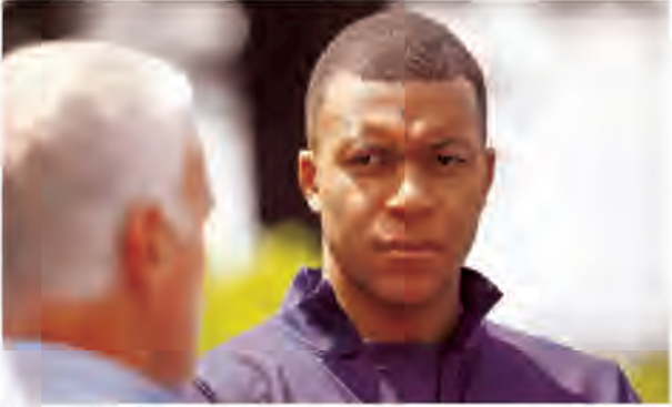
लिए 60 मैचों में 27 गोल और फ्रेंच राष्ट्रीय टीम के लिए 77 मैचों में 46 गोल किया है। उनकी गति और शक्ति के साथ-साथ इस प्रभावशाली

एजेंसी मैड्रिड। रियल मैड्रिड ने पेरिस सेंट जर्मेन (पीएसजी) से फ्री ट्रांसफर पर फ्रांसीसी अंतरराष्ट्रीय खिलाड़ी किलियन एम्बाप्पे के साथ करार किया है। 25 वर्षीय फारवर्ड ने हाल ही में चैंपियंस लीग विजेता के साथ पांच साल का अनुबंध किया है। स्ट्राइकर ने सोशल मीडिया पर लिखा, मैं अपने सपनों के क्लब रियल मैड्रिड में शामिल होने के लिए बेसब्र हूँ। इस पल में मैं कितना खुश हूँ, यह बताता असंभव है। एम्बाप्पे ने पीएसजी के लिए 308 मैचों में 256 गोल, मोनाको के